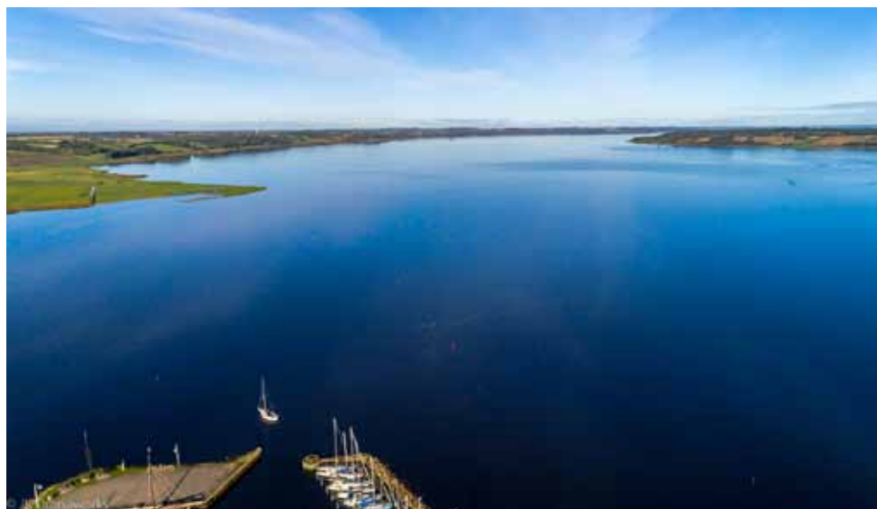
Tak til Jørgen Kærsgaard for forsidefoto og flotte dronebilleder.