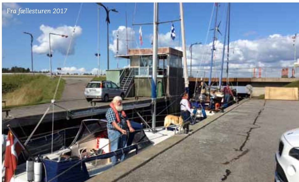
Fra fællesturen 2017